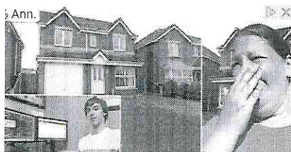
Adolescente locale sorprende la mamma: le compra una casa nuova

Per i due avvocati, infatti, la sentenza è appunto una vittoria solo a metà. Ai ragazzi, rimasti orfani della madre e tolti al padre, che sconta dietro le sbarre la condanna per l'omicidio di Marianna, è stato riconosciuto il risarcimento per i soli danni materiali, e non quelli immateriali. "Vedremo come si pronunceranno i giudici di secondo grado – dice l'avvocato D'Amico - e vediamo cosa ne pensano la Corte europea di Strasburgo" .